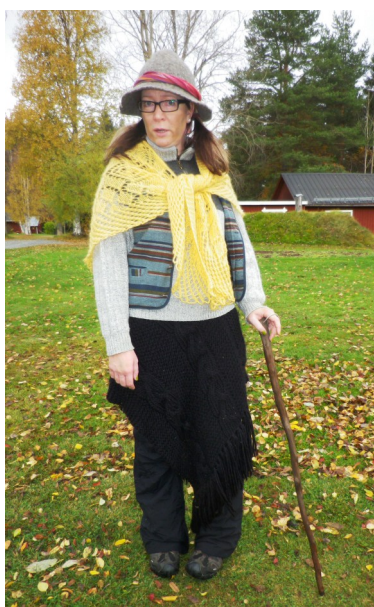
Skogsfrun Klöver är litet bekymrad. Vart har musen tagit vägen?