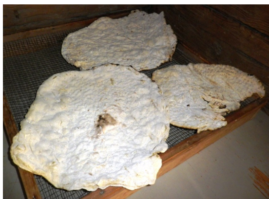
Nya och intressanta former på tunnbrödkakorna.