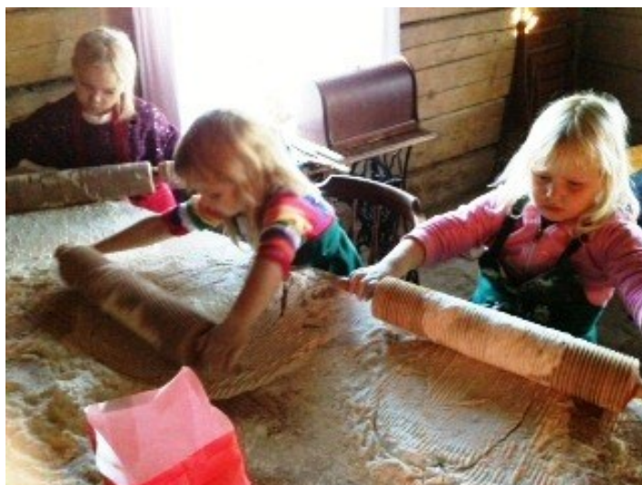
Nu går kavlingen riktigt bra.