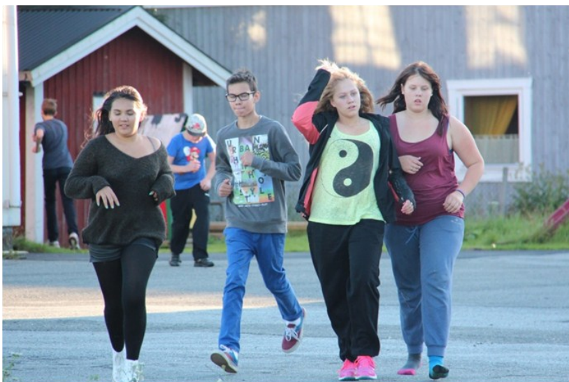
Högstadieläver på hajk i Västane

Norrskog berättar om skogsvård innan tips- promenaden i skogen.