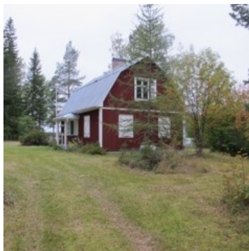
och den andra halvan.