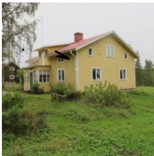
Ena halvan av före detta Johannesnäs herrgård ...